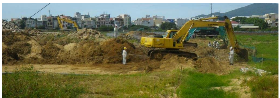
Đào xúc đất và bùn cho Giai đoạn 2

Dự án. Tính đến ngày 30/6/2014, có khoảng 35.000 mét khối đất và bùn nhiễm dioxin đã được đào xúc từ Hồ Sen và vùng nước ngập xung quanh. Đất và bùn này được tập kết tạm thời trong một mố được lót nền và che phủ bên trên trong khi chờ xử lý ở Giai đoạn 2.