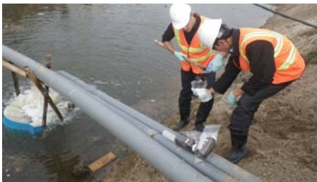
Lấy mẫu nước để đảm bảo sự nhiễm bẩn không lan ra ngoài vùng Dự án