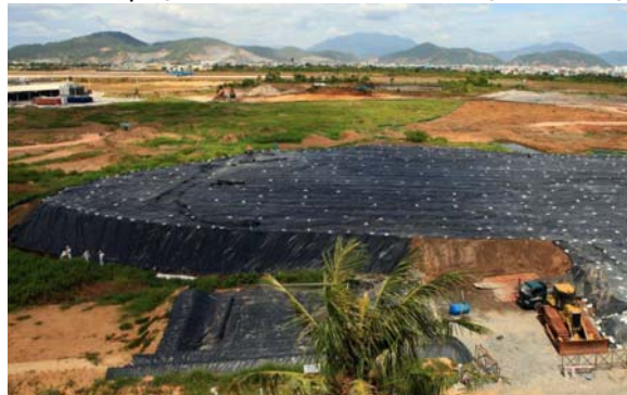
Tập kết tạm đất và bùn cho Giai đoạn 2

Trong khi đất và bùn thuộc Giai đoạn 1 đang được xử lý, các nhà thầu của USAID tiếp tục đào xúc đất và bùn thuộc Giai đoạn 2 ở khu vực phía bắc của