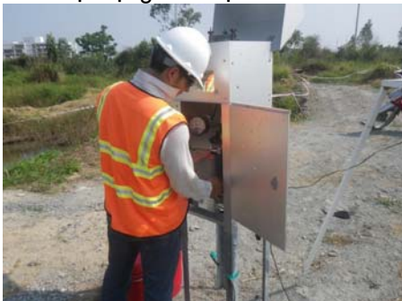
Lấy mẫu khí để đảm bảo sự nhiễm bẩn không lan ra ngoài vùng Dự án

Các hoạt động này bao gồm quan trắc không khí và bụi xung quanh các khu vực có hoạt động và quan trắc nước tại nơi nước được xả thải ra ngoài nhằm đảm bảo ô nhiễm không lan ra ngoài vùng Dự án. Phối hợp chặt chẽ với các nhà thầu của USAID, Bộ Quốc phòng Việt Nam cũng thực hiện công tác quan trắc không khí và nước độc lập đối với các hoạt động của Dự án.