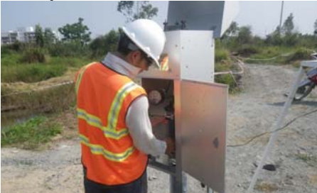
Sampling air to ensure contamination does not leave Project site

These activities include air and dust monitoring at the perimeter of active work zones and water monitoring where water is discharged offsite to ensure contamination does not leave the Project site. In close coordination with USAID's contractors, the Vietnamese Ministry of National Defense also conducts its own independent air and water monitoring of Project activities.