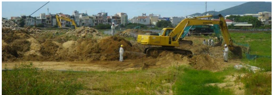
Excavating Phase 2 soil and sediment

site. As of June 30, 2014, approximately 35,000 cubic meters of dioxin-contaminated soil and sediment have been excavated from Sen Lake and the surrounding wetlands. The excavated material is being temporarily stored in a lined and covered pile while it awaits treatment during Phase 2.