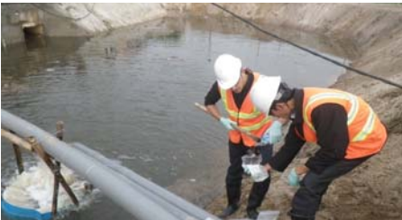
Sampling water to ensure contamination does not leave Project site