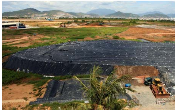
Temporary storage of Phase 2 material

While Phase 1 soil and sediment is being treated, USAID contractors continue to excavate Phase 2 soil and sediment in the northern portion of the Project